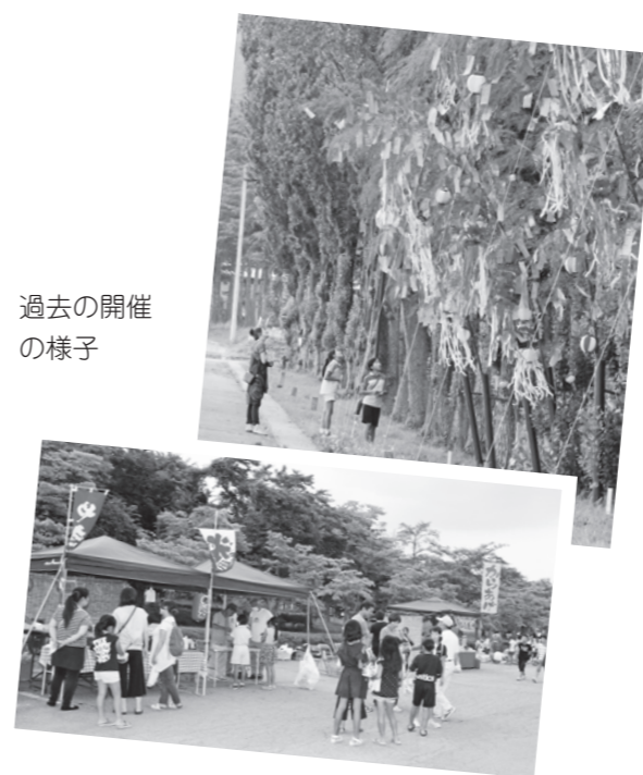
過去の開催の様子