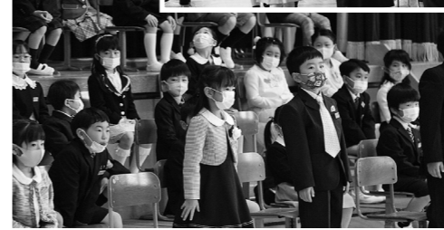
一人ひとり元気に返事ができました