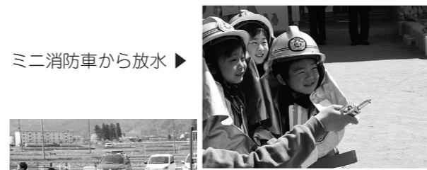
ミニ消防車から放水

新型コロナウイルス感染防止のため毎年4月に行われている春季消防演習が中止となり、町民のみなさんの前でお披露目することはできませんでしたが、観覧に訪れた消防団長へ「火遊びは絶対にしません」と元気に防火の誓いを述べました。