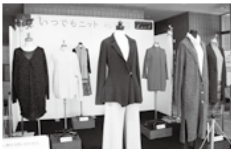
昨年の展示の様子

役場ロビーにニット製品を展示します。 期間 ／12月22日(水)まで ※役場開庁日のみ 時間 ／午前8時30分～午後5時15分 ※最終日は午後3時まで 場所 ／役場1階 ロビー 出展数 ／秋・冬物の新作8点 問合せ ／産業課 商工観光係 ☎ (667) 1106