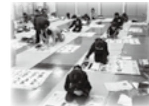
一昨年の教室の様子