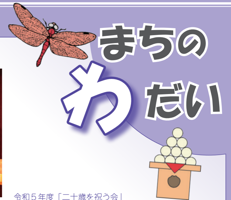
令和5年度「二十歳を祝う会」

8月4日、相模公民館で小学1～6年生8人が『竹あかり』づくりを体験しました。今回は初めて竹遊会の方と竹林を見に行き、竹を切る体験をしてきました。その後、公民館で竹あかりを熱心に作りました。