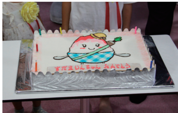
「すだまりんちゃん」ケーキ