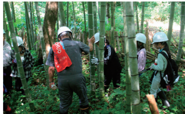
竹遊会の方に教えてもらいながら安全に切りました