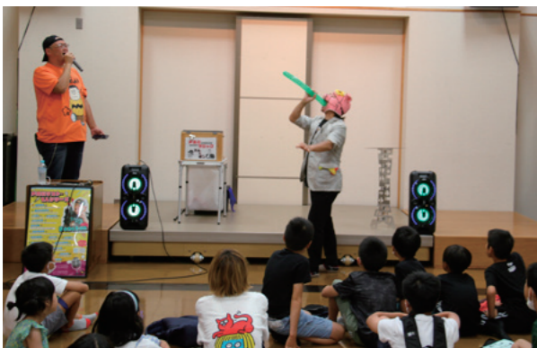
風船を飲み込むマジック！

8月1日、更生保護女性会第3分団、北部公民館合同企画「ミニ集会対賢キッズフェスタ」が開催され、約40人の児童が参加。「ハム&ボン 声真似マジックショー」や「ビンゴゲーム」は大いに盛り上がり、館内には児童の楽しそうな声が響きわたりました。