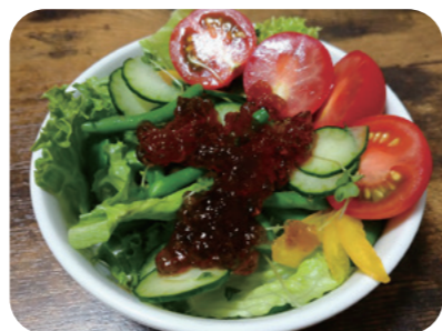
※町ホームページではカラー写真で掲載していますので、ぜひご覧ください