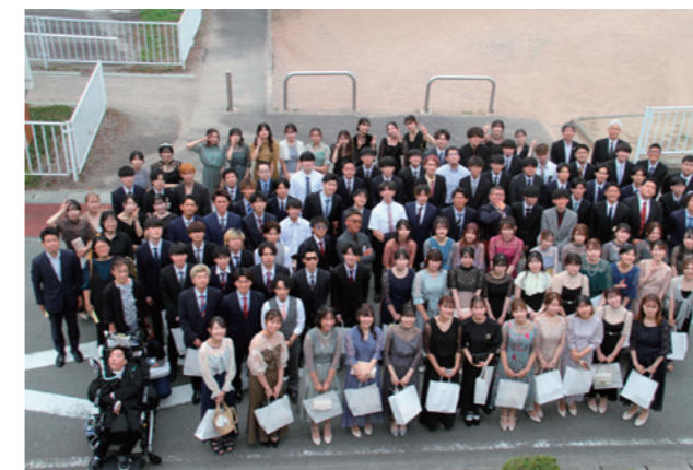
夢に向かって新たな一歩を踏み出した二十歳のみなさん