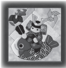
※サイズ15.3×15.3cm (額の外寸は18.5×18.5cm)