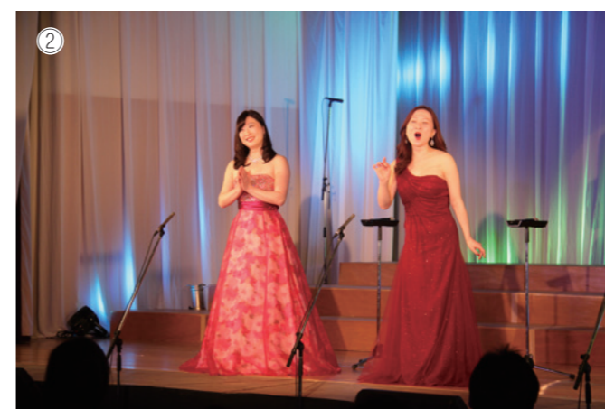
①出演者全員で「花のいろ」の合唱！ ②シュガーシスターズのステージ