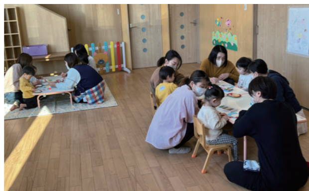
親子で楽しく作りました