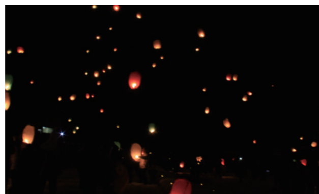
スカイランタンが夜空を彩りました

町制施行70周年記念事業として『第30回まんだらの里・雪の芸術祭2024』が2月10日に作谷沢ふれあい自然館周辺で開催されました。スカイランタンの打ち上げイベント“SKY LIGHT～天灯～”が行われ、幻想的な雰囲気に包まれました。