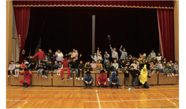
参加した子どもたち