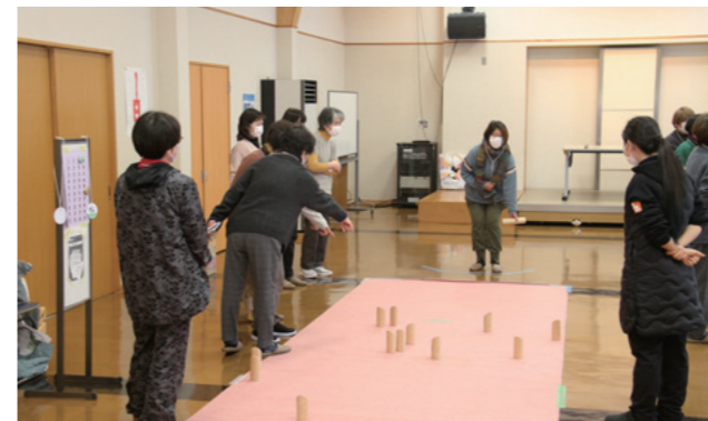
各地区での開催を考えながらも、ゲームはたいへん盛り上がりしました

1月30日、山辺北部公民館にて、毎年恒例の山辺町更生保護女性会研修会が開催されました。当日は会員、指導者を含め50人が参加し、同会の活動理念でもある「地域における犯罪予防の活動」「助け合い、思いやりの輪をひろげる、健全な子どもたちの育成」「会員相互のつながりを大切に、地域をよく知り、地区児童と触れ合う」など、次年度の各地区においての「ミニ集会」開催に活かせるよう、多くの会員が体験しました。体験後は、会員が調理した美味しい豚汁、おにぎりを食べながら、問題点や改善点など、真剣に話し合い、たいへん実のある研修会になりました。