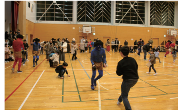
「鬼は外、福は内」と鬼退治

2月3日、旧大寺小学校に子どもたちの弱いココロの化身である“ のべ Nobe鬼”が参上。参加した子どもたちは、与えられたミッションをクリアし豆をゲットした後、Nobe鬼と豆まき合戦。鬼に向かって力いっぱい豆を投げ、自分の弱いココロとNobe鬼と一緒に退治しました。