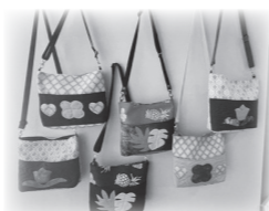
※デザインは6パターンから選択できます。