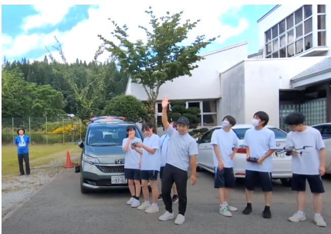
↑ドローン操作練習