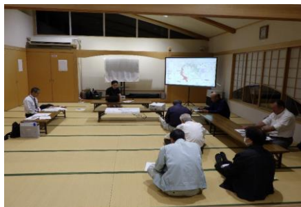
（地権者説明会の様子）