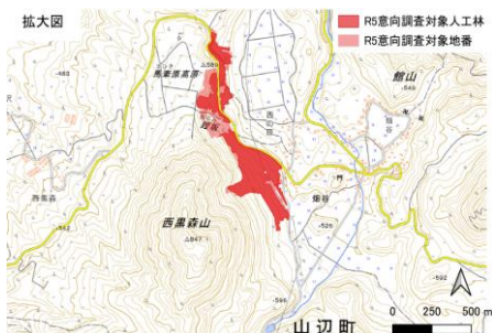
（意向調査実施地区）