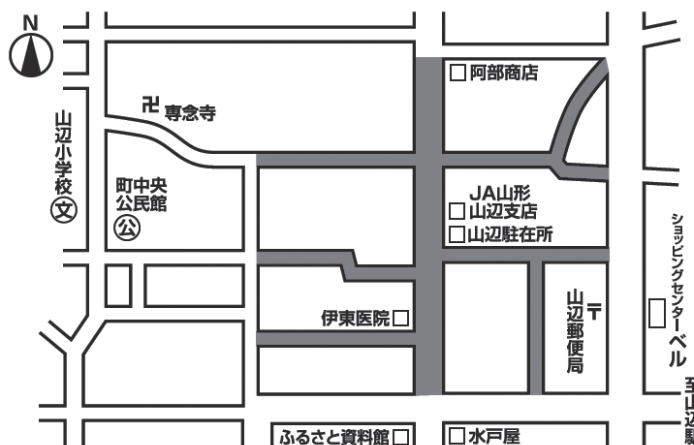
会場周辺図（網掛け部分が通行止め箇所）

※当日、安全確保のため、会場周辺が車両通行止めとなります。ご理解とご協力をお願いします。