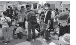
※たけのご祭りの様子