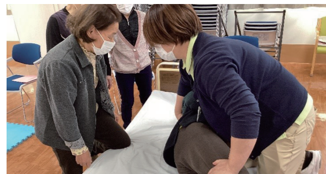
移動・起き上がりを体験

11月5日と12日の2日間、やまのべ荘（デイサービス棟2階）で介護力講座が開催されました。講座では、日常生活の中で役立つ介護の基礎知識に加え、身体の支え方や移動の補助といった実技も丁寧に学ぶことができました。参加者は施設の職員から直接アドバイスを受けることで、多くの新しい知識を得ることができました。