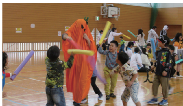
力を合わせてハロウィンモンスターを撃退！