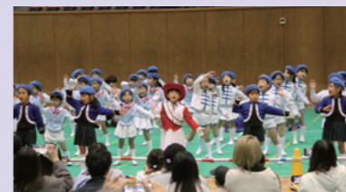
園児たちによるステージ発表