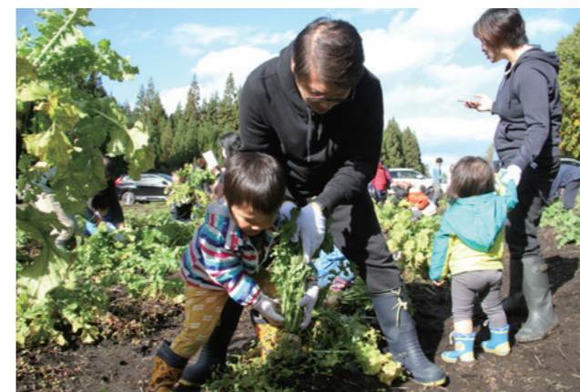
親子で仲良く収穫

10月30日、須川グラウンドゴルフ場で「第57回きららクラブ山辺グラウンドゴルフ大会」が開催されました。早朝までの雨で芝が湿っていたため、思うようにボールが転がらず苦戦する場面も見られましたが、参加者は互いに声を掛け合いながら、元気いっぱいにプレーを楽しんでいました。