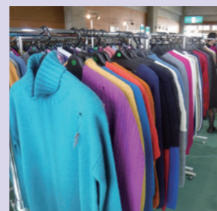
山辺ニットの即売会