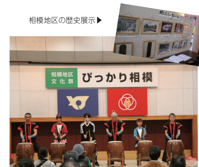
山辺太鼓鶴稜による迫力ある太鼓演奏