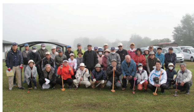
みんなで和気あいあいとグラウンドゴルフ

10月26日、大寺地区ブロック協議会が主催の「ドキドキ探検ハロウィン」が旧大寺小学校で開催されました。当日は、仮装した約100人の子ども達が校舎内を探検し、最後はハロウィンモンスターとのゲーム大会で大盛り上がり。ボランティアで山辺高校の生徒たちも加わり、子ども達の笑顔があふれる1日となりました。