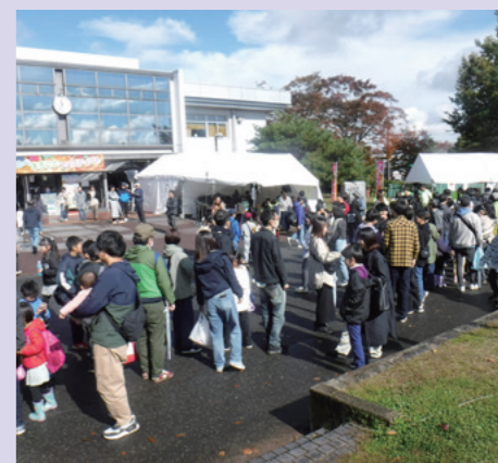
約2万人の来場者で大にぎわい！！