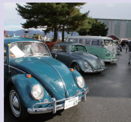
バグフェスには個性的な車がいっぱい！