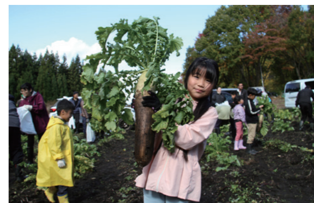
約40cmの大根を掘り当てる参加者も！