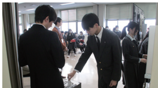
模擬選挙で選挙への関心を高めました