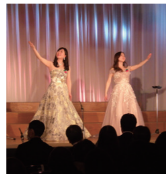
シュガーシスターズのお二人