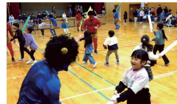
みんなで楽しく鬼退治！

2月1日、「第10回ココロの節分」が旧大寺小学校で行われ、約100人の子どもたちが参加しました。このイベントでは、子どもたちの弱いココロを具現化した「Nobe鬼」が登場し、子どもたちの健全な成長とココロの弱さの克服を願いながら、一緒に豆まきを楽しみました。