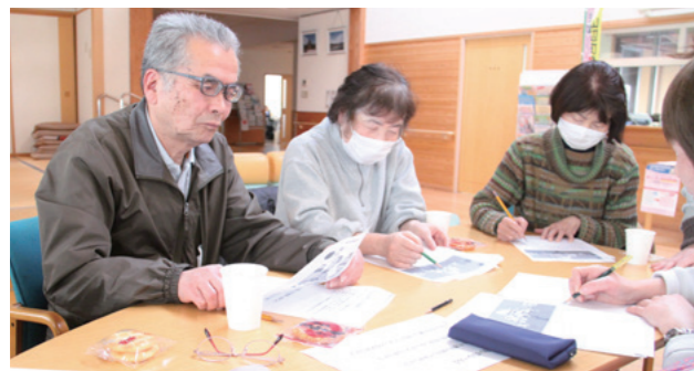
「チームオレンジ」をテーマにグループワーク

1月23日、保健福祉センターで開催された認知症カフェのテーマは「チームオレンジってなあに？」。認知症の方もそのご家族も、地域の中でともに安心して暮らせる「共生」を目指すもので、少人数のグループに分かれて学びを深めながら、不安や戸惑い、安心したい気持ちなどを分かち合う時間となりました。