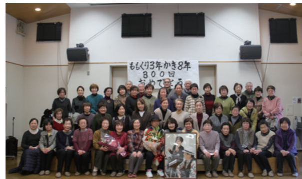
300回を祝い、参加者全員で記念の一枚