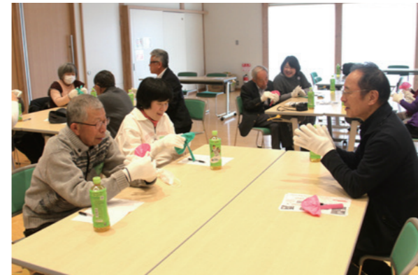
手先の不自由さを体感するため、軍手を着用してペーパーフラワー作りに取り組みました

3月28日、山辺ロータリークラブパラレル委員会主催の、「山辺町手をつなぐ育成会との交流会」が緑ヶ丘コミュニティセンターで開催されました。知的障がいへの理解を深めることを目的として開催され、講師に花笠ホープ隊を招き、ユーモアを交えた講話や疑似体験を通して、参加者は理解を深めました。また、4月22日には、長沼公園で山辺ロータリークラブ社会奉仕委員会による社会奉仕活動が行われました。この活動により、多くの利用者が気持ちよく利用できる環境へと整えられました。