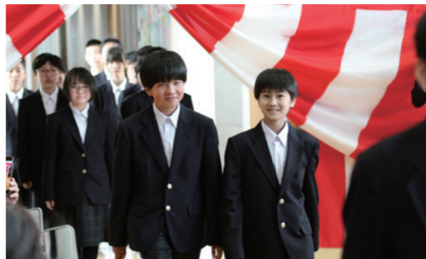
真新しい制服に身を包んだ新入生が入場しました(山辺中)