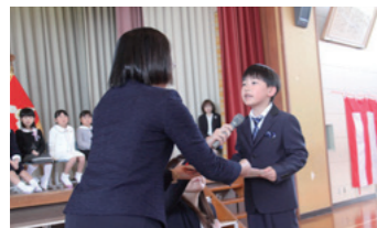
◀校長先生から教科書が手渡されました

4月8日から9日にかけて町内の小・中学校で入学式が行われ、令和8年度は小学生77人、中学生116人が入学しました。小学校の入学式では、先生から新入生一人ひとりの名前が呼ばれ、元気に返事をする姿が見られました。また、新入生へ教科書や花束が手渡され、新入生たちはこれから始まる学校生活に期待を膨らませていました。