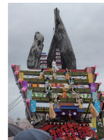
ユネスコ無形文化遺産「日立風流物」

参加者は、満開の桜や活気あふれるイベント、海の幸など日立市の魅力を満喫しました。また、山辺町のブースでは、山形芋煮や玉こんにゃく、舞米豚を使った豚汁などを販売し、大盛況となりました。