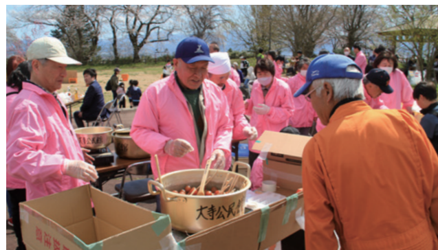
玉こんにゃくや団子を食べながらお花見

4月12日、大寺ふれあい公園にて、「大寺さくらまつり」が開催されました。会場では、ゲームやモルック体験などさまざまな催し物が行われ、子どもから大人まで楽しんでいました。また、会場には団子や玉こんにゃく、焼きそばなどの売店も並び、来場者は桜を眺めながら春の訪れを感じていました。