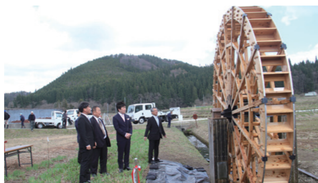
直径5メートル、重さ500キロでより頑丈に！