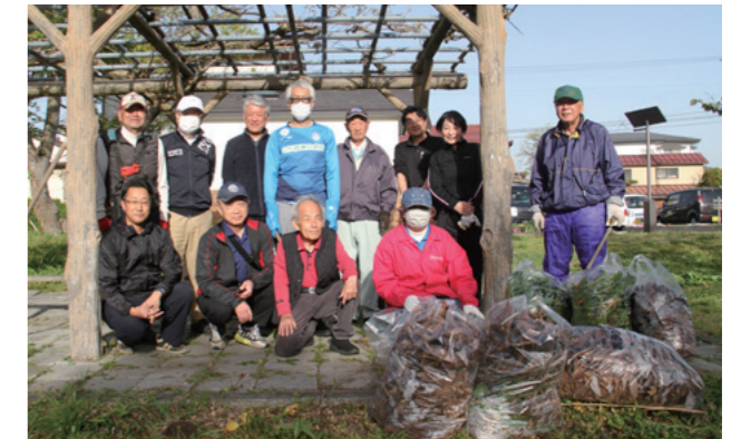
公園の草刈り作業に汗を流しました