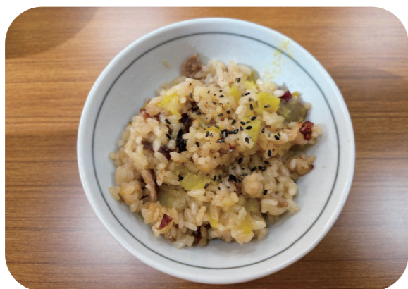
※町ホームページではカラー写真で掲載していますので、ぜひご覧ください