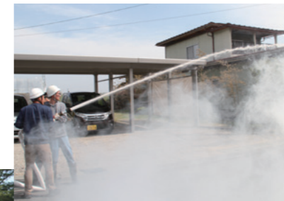
▶地域住民による初期消火訓練