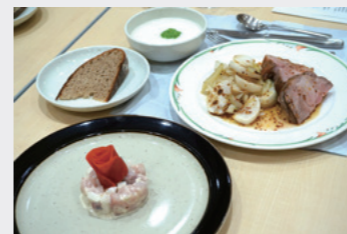
山辺町産にこだわったコース料理

家庭で楽しめるフレンチ料理教室を開催し、「山辺町産のカブとブリのタルタル、カブのポタージュ、舞米豚ロースト」を作りました。