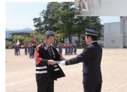
◀感謝の意を込め、町長から前団長へ感謝状が渡されました