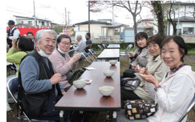
笑顔あふれる会になりました

4月16日、近江公園でお花見とお茶会が開催されました。会のはじめには山辺駐在所の方から交通安全などのお話があり、その後は、みんなでお茶会。にぎやかで和やかな時間となりました。