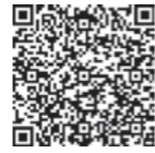
やまがた若者定着