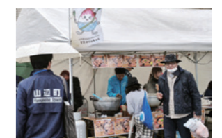
特産品売り場の様子