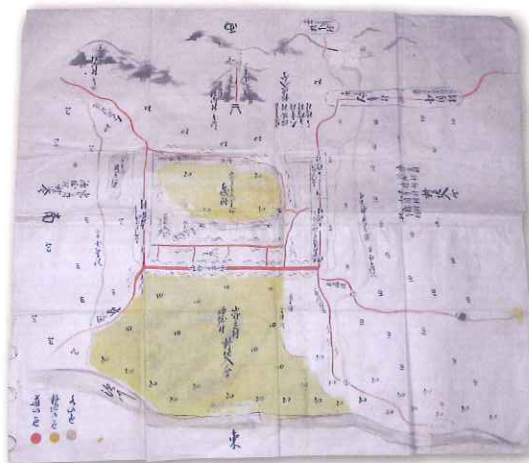
▲山野辺村耕地絵図