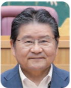
村山 幸一 (町長) サイクルツーリズムの推進に取組んでいく