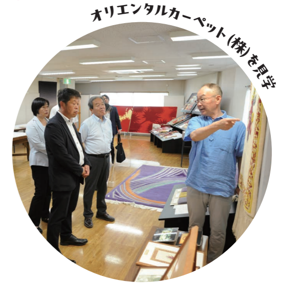
オリエンタルカーペット(株)を見学

また、昨年9月には、山辺町議会議員全員で日立市へ表敬訪問するなど、両議会においても互いに交流を図っています。