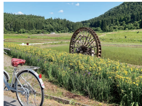
サイクルツーリズムで、美しい自然風景「やまのべ」の魅力を感じてほしい。(写真は作谷沢の湧水車)