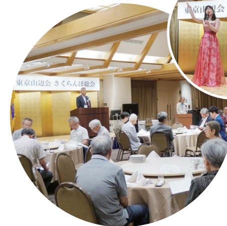
東京山辺会 さくらんぼ総会