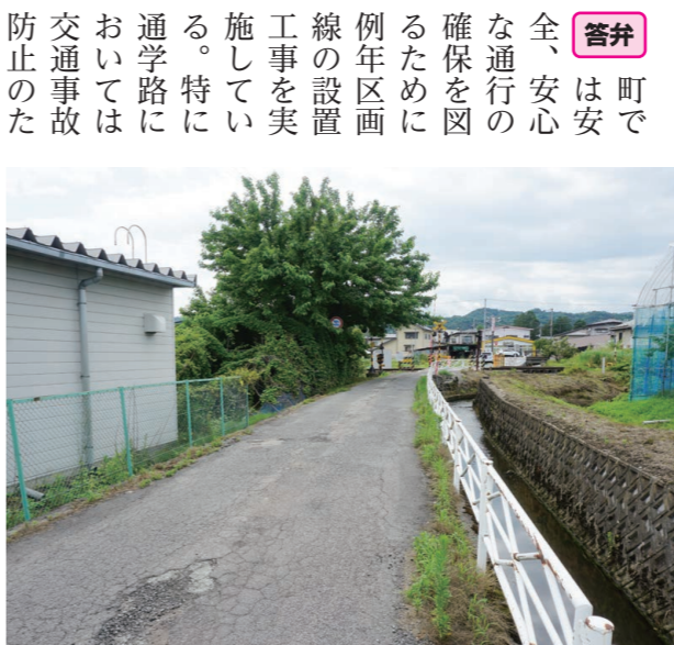
昔から利用されている町道東町境ノ目線

答弁 町では安全、安心な通行の確保を図るために例年区画線の設置工事を実施している。特に通学路においては交通安全事故防止のため