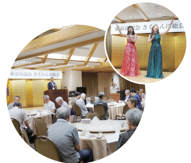
東京山辺会 さくらんぼ総会