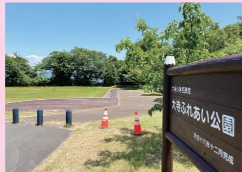
広場の復旧が必要になった大寺ふれあい公園 ～ルールを守って大切に利用しましょう～

※ 0-60モンテディオやまびこ …モンテディオ山形が展開する、高齢者の健康と社会参加を「声」を通じて支援する活動。