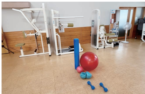
健康教室で、いつまでも元気に