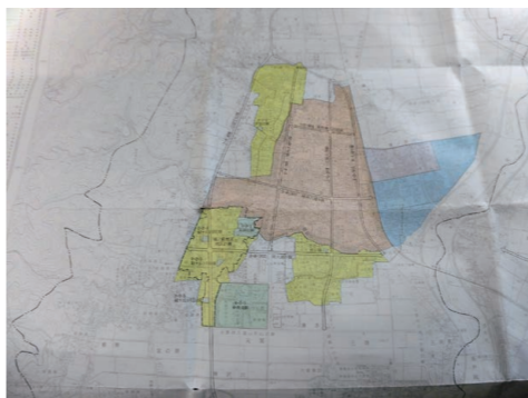
市街化区域と市街化調整区域の線引き図

質問 山辺町土地利用にトチームを立ち上げ、市街化調整区域（線引きの廃止・34条11号の条例化・地区計画申し出制度等）について、検討している。