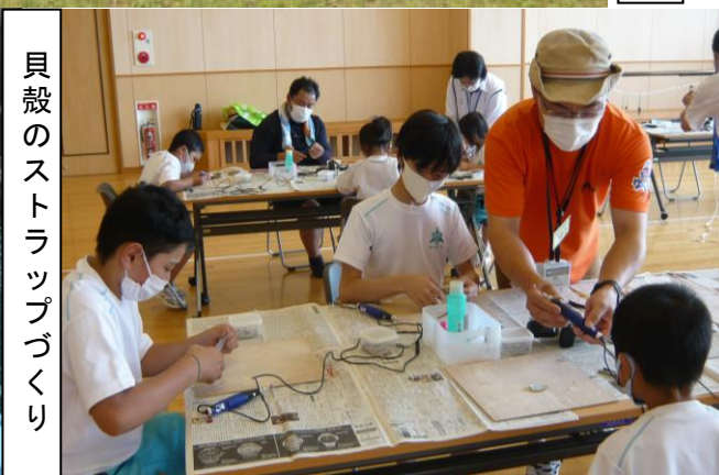
貝殻のストラップづくり