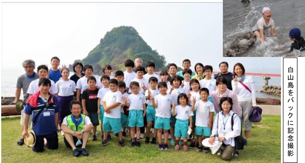
白山島をバックに記念撮影

初めて海に入った子は、海水のしょっぱさにびっくり。寄せては返す波のしぶきに歓声を上げてはしゃぐ姿、砂浜遊びに夢中になる姿、貝殻やワカメ・シーグラスを拾って大事そうにポケットにしまい込む姿などが見られました。開放感あふれる広い海を目の前に、子どもたちも思い切り羽を伸ばすことができたようです。昼食後は、クルージングと貝殻クラフトを体験しました。日帰りの短い滞在でしたが、子どもたちも教職員も夏の海を満喫することができました。