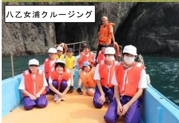
八乙女浦クルージング