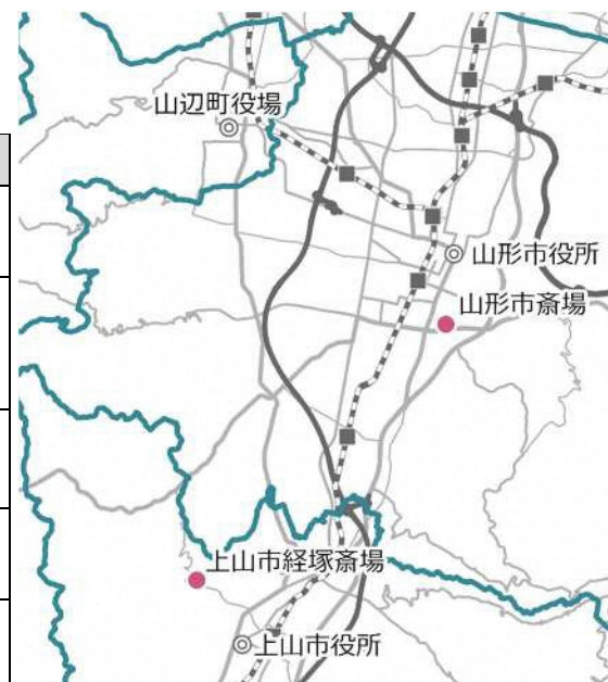
現在の斎場位置図